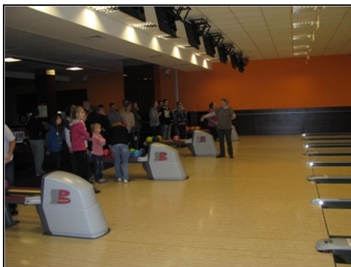
Pobyt na kręgielni był ukoronowaniem działań w projekcie.

o charakterze edukacyjnym, kulturowym, sportowym, ekologicznym czy turystycznym.