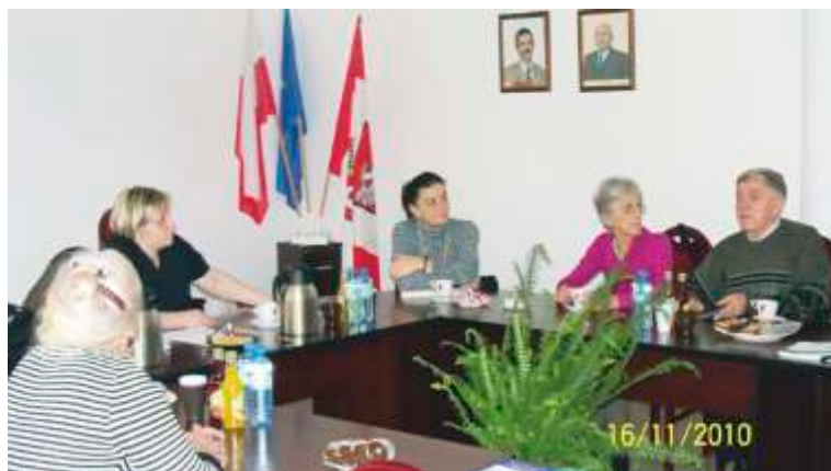
Grupa wsparcia z kuratorem zawodowym