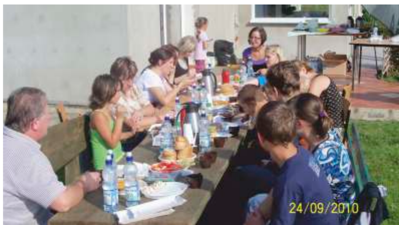
piknik dla niespokrewnionych rodzin zastępczych