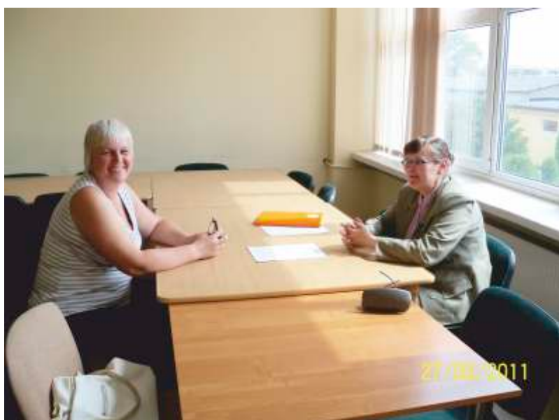
Indywidualne konsultacje z psychologiem podczas warsztatów nauki planowania udanego życia.