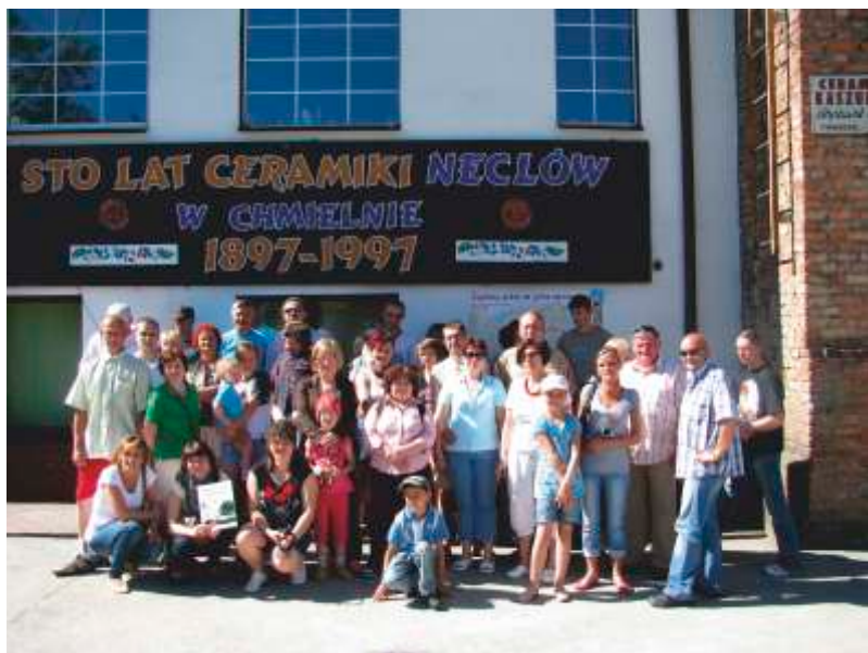
Wycieczka na Kaszuby. Uczestnicy przed pracownią garncarską w Chmielnie.