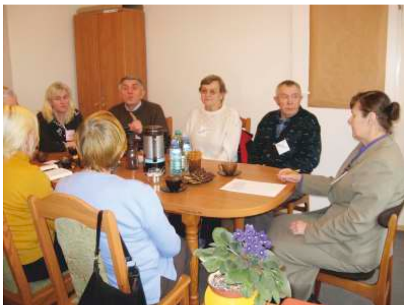
Grupa wsparcia z psychologiem