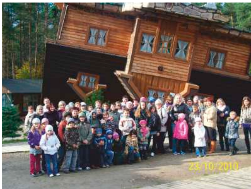
Wycieczka do Szymbarku