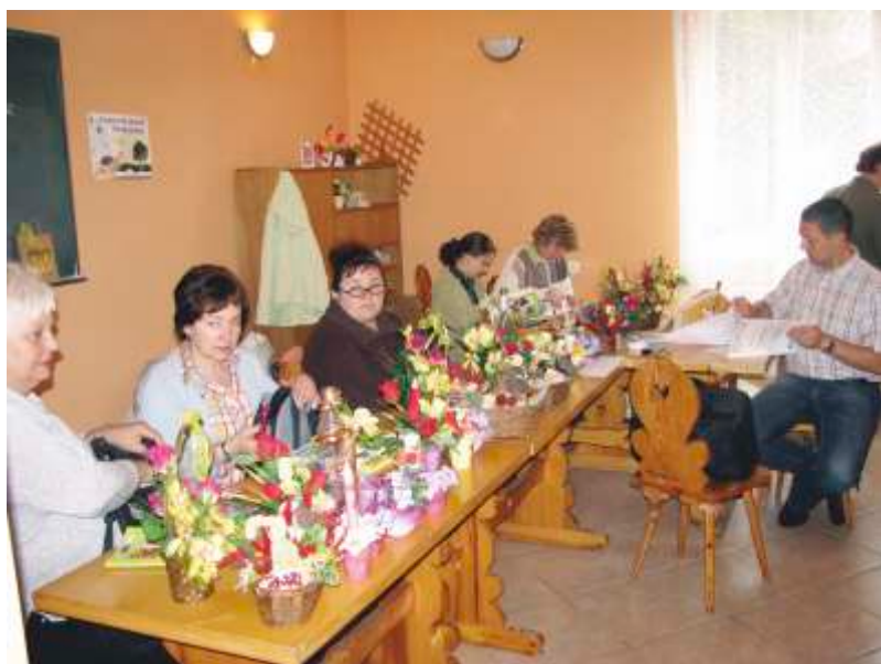
Kurs pamiątkarstwo z bukietarstwem