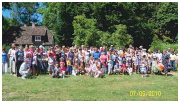
piknik z okazji dnia rodzicielstwa zastępczego