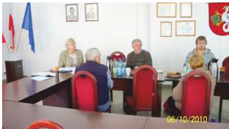
Grupa wsparcia z psychologiem