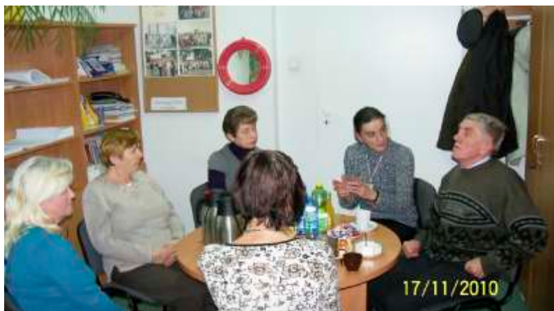
Grupa wsparcia z pracownikiem socjalnym