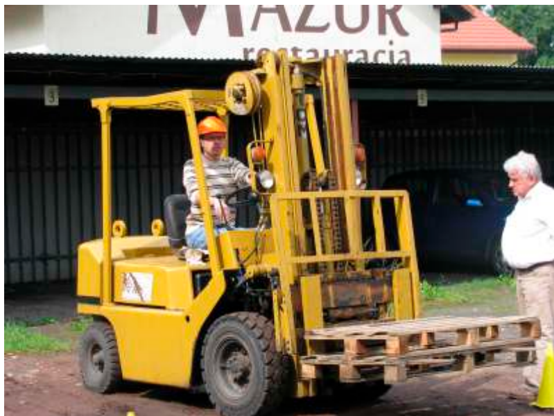
piknik dla niespokrewnionych rodzin zastępczych