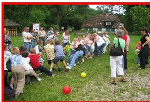
Piknik z ogniskiem dla rodzin zastępczych.