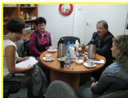
Grupa wsparcia z pracownikiem socjalnym