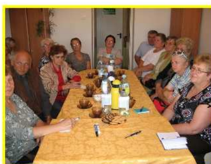
Grupa wsparcia z psychologiem