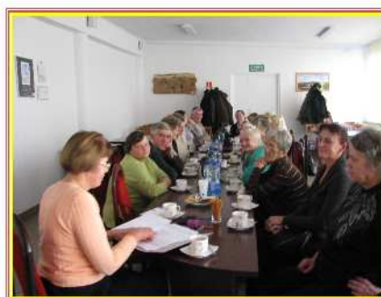
Grupa wsparcia z radcą prawnym