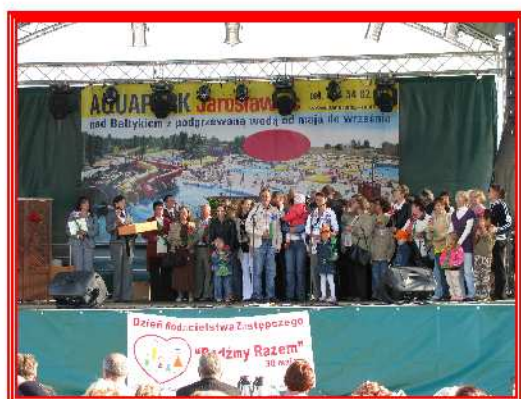
Obchody Dnia Rodzicielstwa Zastępczego.